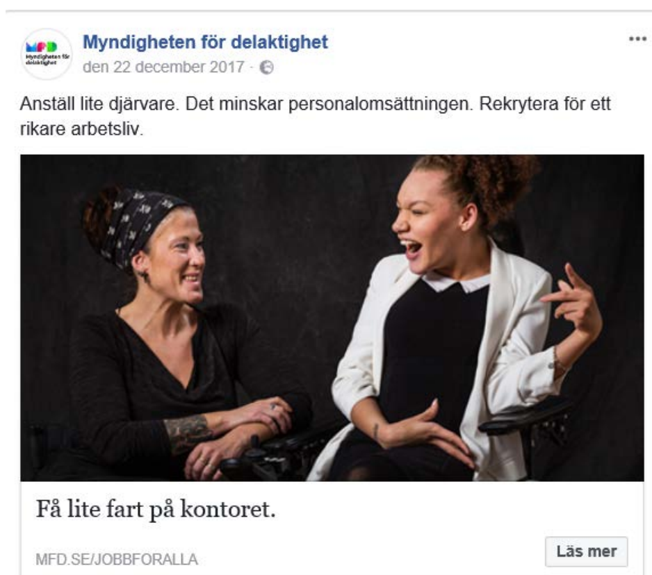
Bild 3. Exempel på Facebookannonser.

Bilden på de två kvinnorna som använder rullstol hade undertexten: Få lite fart på kontoret. Texten i inläggen var: Anställ lite djärvare. Det minskar personalomsättningen. Rekrytera för ett rikare arbetsliv.