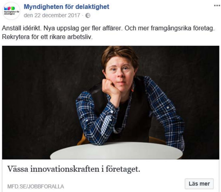
Bild 2. Exempel på Facebookannonser.

Bilden på den unge mannen med Downs syndrom hade undertexten: Vässa innovationskraften i företaget. Texten i inläggen var: Anställ idérikt. Nya uppslag ger fler affärer. Och mer framgångsrika företag. Rekrytera för ett rikare arbetsliv.