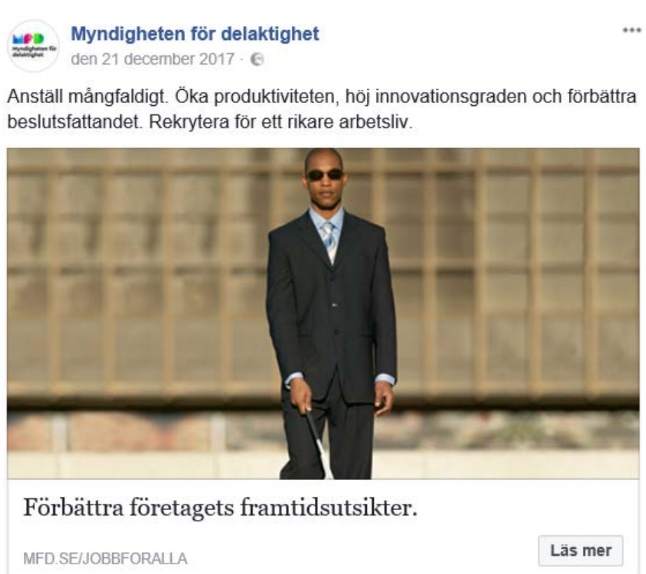
Bild 1. Exempel på Facebookannonser.

Bilden på den synskadade mannen hade undertexten: Förbättra företagets framtidsutsikter. Texten i inläggen förekom med vissa variationer: Anställ mångfaldigt. Öka produktiviteten, höj innovationsgraden och förbättra beslutsfattandet. Rekrytera för ett rikare arbetsliv.